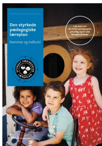
Den styrkede pædagogiske læreplan. Rammer og indhold

Denne skabelon indeholder alle de lovmæssige krav til evalueringen. Lovkravene finder I i de to midterste afsnit "Evaluering og dokumentation" og "Inddragelse af forældrebestyrelsen". Skabelonen indeholder desuden spørgsmål, som kan støtte jeres evalueringsproces samt jeres fremadrettede arbejde med løbende at revidere den skriftlige læreplan.